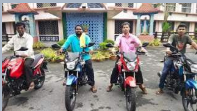
India: quattro motociclette per il lavoro socio-pastorale delle missioni vincenziane di Jubaguda, Kottogodo, Dukuma e Padangi

Questi sono alcuni dei progetti che sono stati resi possibili grazie all'aiuto dei nostri partner e donatori per tutto il 2021. Per maggiori informazioni sui progetti, visitate il nostro sito web: www.cmglobal.org/vso-es