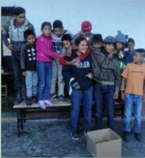
Messico: Ristrutturazione del Centro di accoglienza e salute per bambini indigeni nella Missione di Sierra Tarahumara, Chihuahua