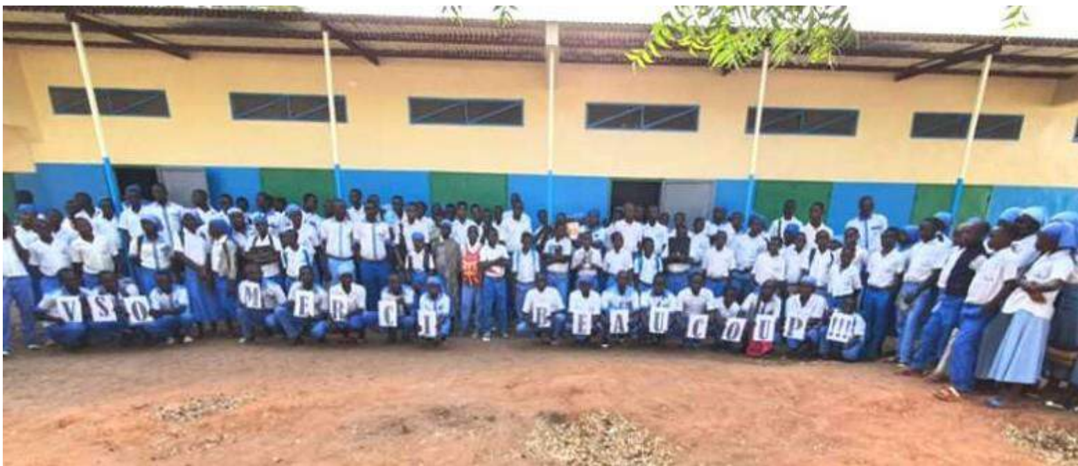
Ciad: costruzione di una sala polivalente per il Lycée Collège St. Jean-Baptiste de Bebalem