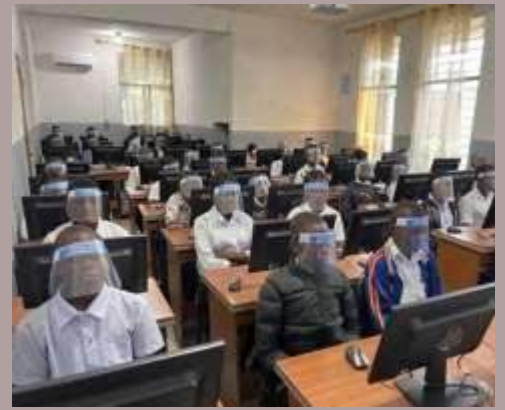
Laboratorio informatico per il complesso scolastico di San Vincenzo de' Paoli a Kinshasa.