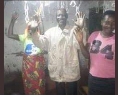
Burundi: elettrificazione del complesso parrocchiale, del presbiterio e di 60 case locali a Rwisabi e Kidasha