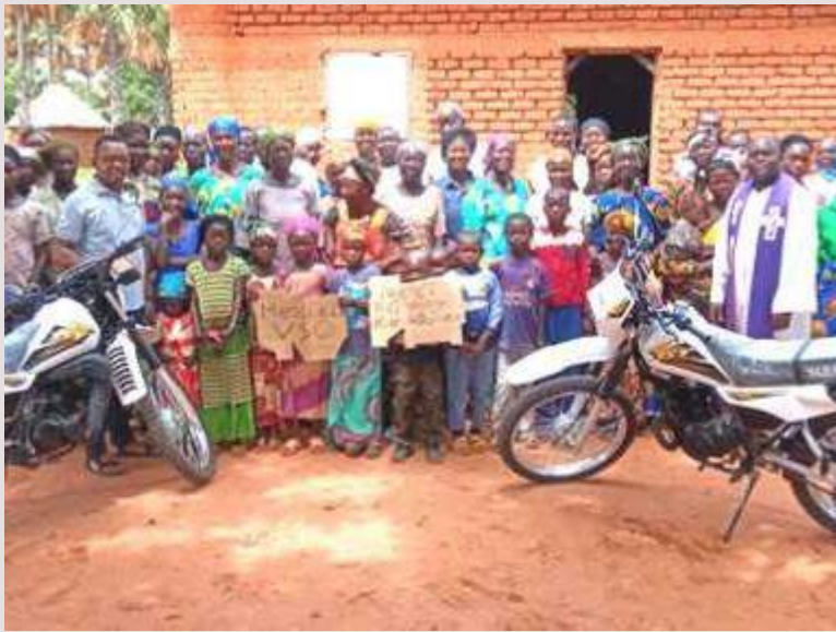
Ciad: acquisto di tre motociclette per la missione parrocchiale di Bebalem