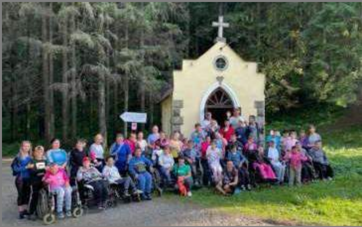
Ucrania (prima della guerra): ritiro per i residenti disabili dell'orfanotrofo e del convitto di Zaluchansk.