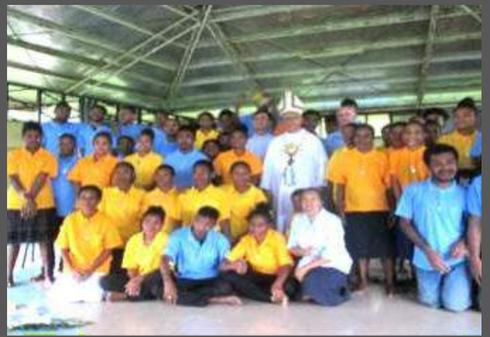
Papua Nuova Guinea: formazione di missionari laici per progetti pastorali