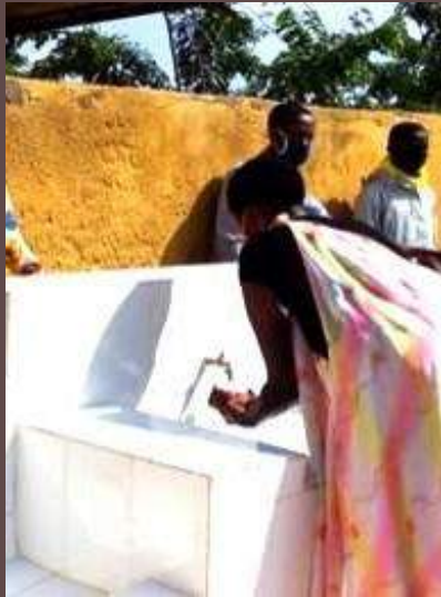
Ruanda: installazione di attrezzature sanitarie, tra cui stazioni di lavaggio delle mani per la lotta contro il COVID 19, per la chiesa del campo profughi di Mahama.