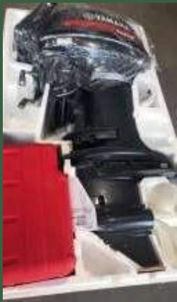
Honduras: acquisto di un motore da 40 cavalli per le visite pastorali alle 32 comunità della parrocchia di Santa Cruz.