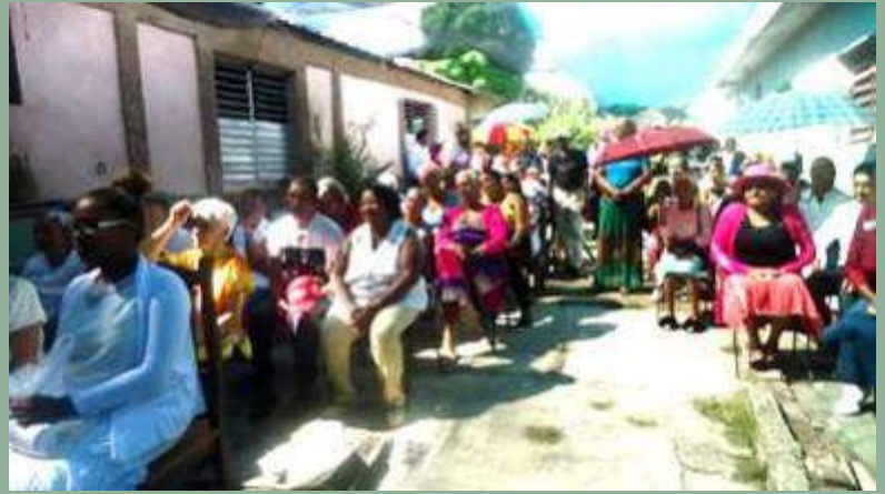
Cuba: casa pastorale con programma di alimentazione per la popolazione anziana locale