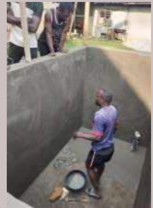
Camerun: costruzione di un allevamento ittico per la crescita della sicurezza alimentare