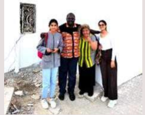
Tunisia: Riparazione di case per anziani