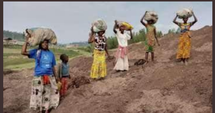
Ruanda: espansione della piantagione di caffè nella parrocchia di Gitare