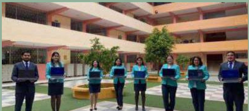
Ecuador: computer per gli insegnanti della scuola di San Vincenzo de' Paoli