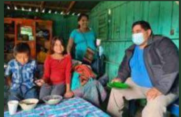
America centrale: Aiuto alimentare per le famiglie colpite dal COVID 19