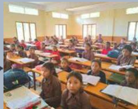
India: arredamento dell'ostello femminile di Klurdung, Assam