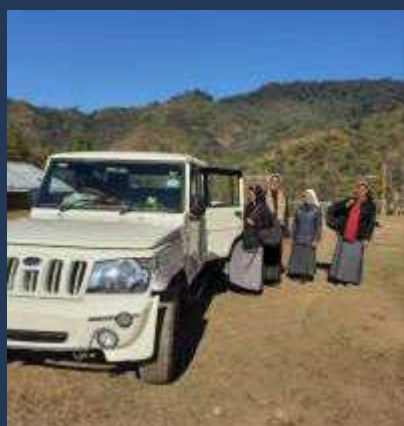
India: Jeep per la stazione missionaria di Wakka nell'Arunachal Pradesh, diocesi di Miao