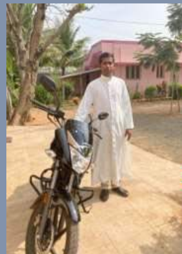
India: tre motociclette per il Seminario DePaul, la Chiesa di San Giuseppe e il Servizio sociale di Sountham