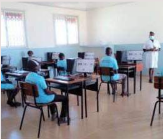
Mozambico: Laboratorio informatico per la scuola secondaria del villaggio di Chinhacanine