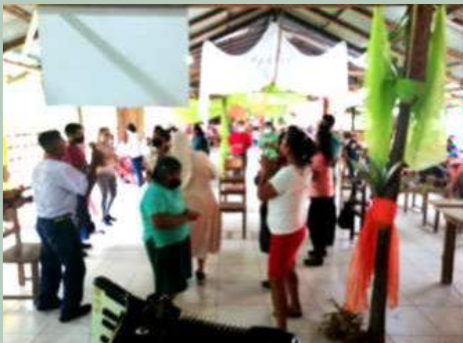
Ristrutturazione della sala parrocchiale e del dell'ostello