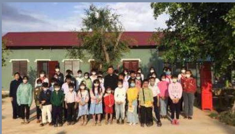
Vietnam: costruzione di una canonica per le lezioni di catechismo, le prove del coro e altre attività comunitarie