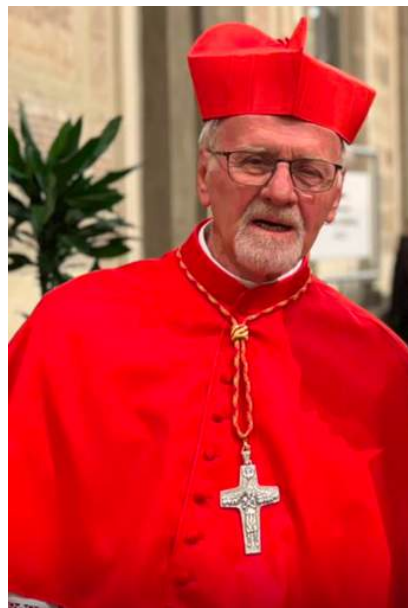
P. Vicente Bokalič Iglič, Archevêque de Santiago del Estero (Primat d'Argentine), créé Cardinal par le Pape François au Consistoire du 7 décembre