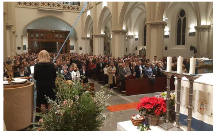
À Madrid, la clôture de l'Année jubilaire de la Basilique La Milagrosa