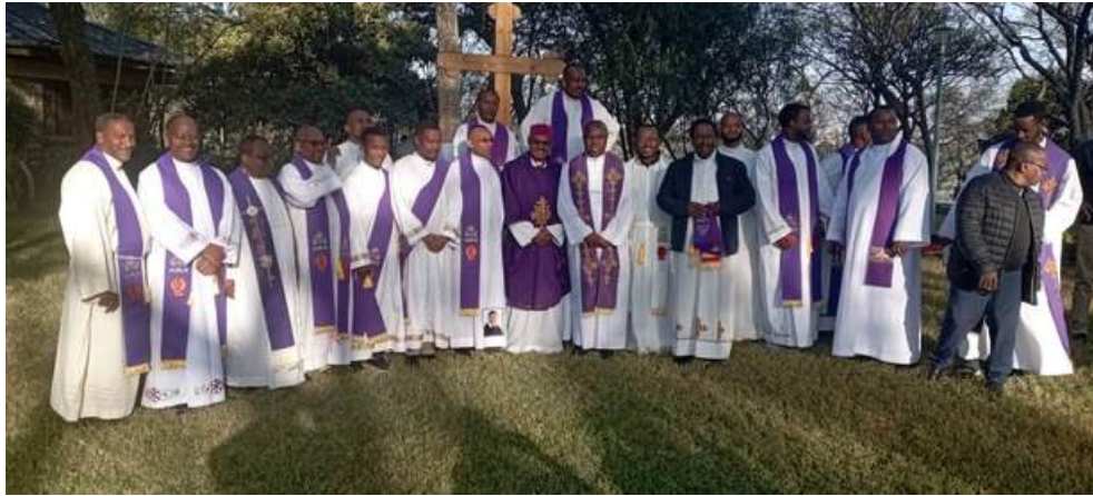
Assemblée Provinciale en Éthiopie