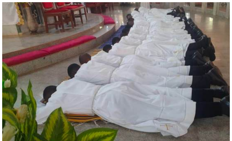
En Nigeria, l'ordination diaconale de 16 confrères

La rédaction de Nuntia souhaite à ses lecteurs un Joyeux Noël