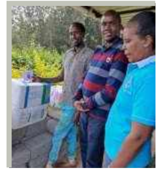
Il parroco della parrocchia di St. Vincenzo

Condividendo queste storie, continuano a imparare gli uni dagli altri. Sono incoraggiati ad espandere le loro attività e continuano a ricevere una formazione sulla gestione del denaro. Particolarmente popolare è la componente di risparmio della gestione dei prestiti. I partecipanti sono diventati più fiduciosi nelle loro attività commerciali e sentono che saranno più resistenti quando dovranno affrontare tempi difficili. Ora hanno una speranza per il futuro.