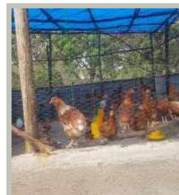
Galline ovaiole nel nuovo pollaio della parrocchia di Alem Tena