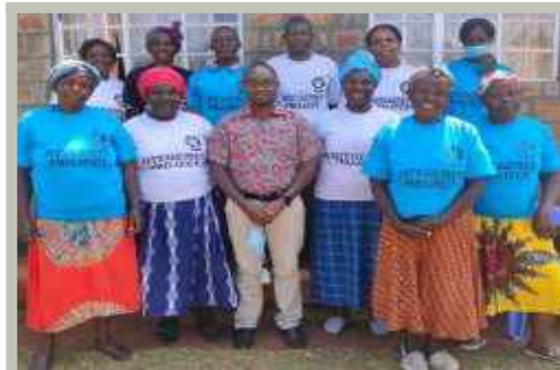
Foto di gruppo dei partecipanti di San Kizito,

Con i loro prestiti hanno comprato fertilizzanti e mangimi. Tutti gli imprenditori continuano a incontrarsi nei loro gruppi parrocchiali per condividere storie di successo e di superamento delle