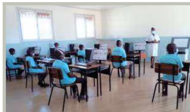
Aula di informatica già allestita con gli studenti e l'insegnante di informatica che spiega come prendersi cura dei computer.

Hanno comprato sei computer, un tablet e una stampante. Un falegname ha aiutato con tavoli e sedie. Hanno assunto un istruttore e hanno aggiunto gli studi di informatica al curriculum. Con le loro nuove competenze informatiche, i laureati avranno migliori prospettive di lavoro. Anche se è ancora nelle fasi iniziali, ha fatto un buon inizio e ha arricchito il curriculum per i 60 studenti partecipanti.