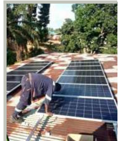
Installation sur le toit de panneaux solaires pour les bureaux de la Paroisse