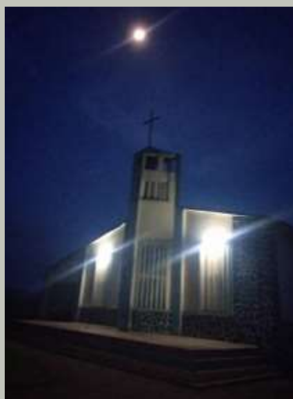
La Chapelle avec toutes les lumières allumées le soir