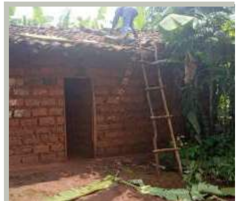
Un paroissien local installant un système domestique

Au Burundi, il y avait l'obscurité, et maintenant il y a la lumière.