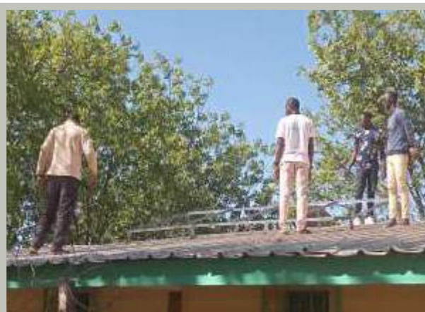
Installation des panneaux solaires sur le toit

La maison a maintenant de la lumière 24 heures sur 24. Mais l'un des autres grands changements qu'ils ont réalisés est une économie de temps et d'argent sur la nourriture. Maintenant qu'ils ont l'électricité 24 heures sur 24, ils peuvent faire fonctionner un réfrigérateur et un congélateur. Cela leur permet d'acheter de la nourriture en grandes quantités, qui est moins chère. Le personnel passe moins de temps à faire les courses.