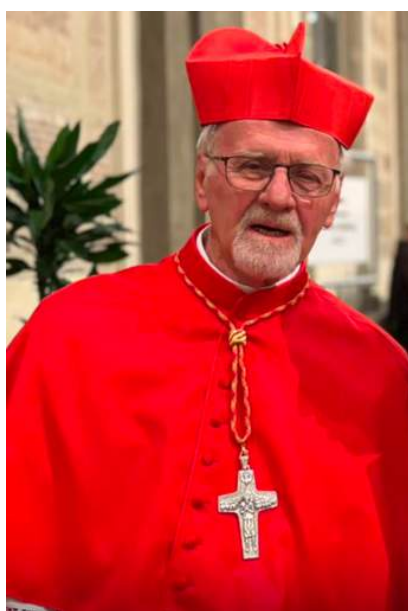
P. Vicente Bokalič Iglič, Arzobispo de Santiago del Estero (Primado de Argentina), creado Cardenal por el Papa Francisco en el Consistorio del 7 de diciembre.