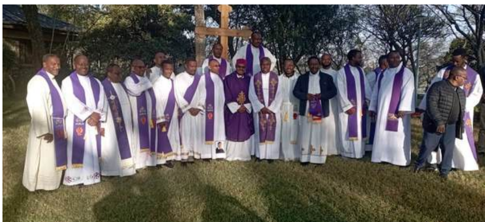
Asamblea Provincial en Etiopía