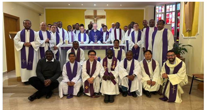
Reunión en la Curia General de los Cohermanos estudiantes en Roma