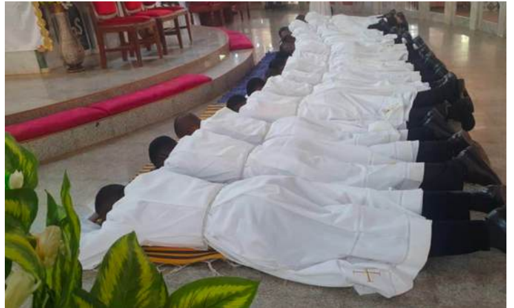
Ordenación diaconal de 16 cohermanos en Nigeria

La redacción de Nuntia desea a sus lectores una Feliz Navidad