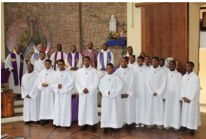
Acogida de 15 estudiantes, lectorado y acolitado en Madagascar