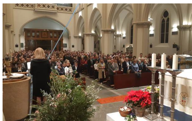
Clausura en Madrid del Año Jubilar de la Basílica de la Milagrosa