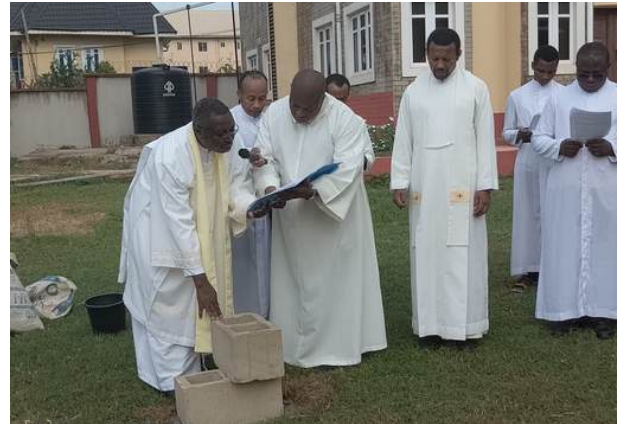
Bendición para el inicio de las obras de la capilla de Enugu (Nigeria)