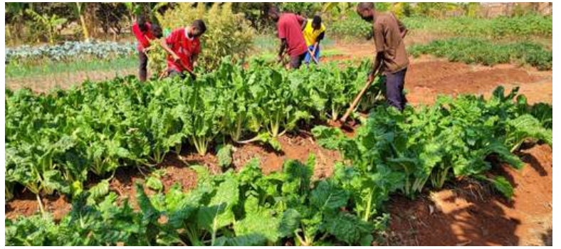
En Tanzania, la compra de un autobús para nuestros seminaristas y el proyecto agrícola; gracias a nuestros bienhechores.